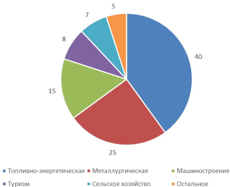
Рисунок 3: Отрасли экономики страны X, %

Доля промышленности в ВВП представлена в таблице 1: